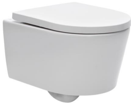
Ukázka 3: Závěsná toaleta