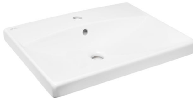
Ukázka 4: Keramické umyvadlo